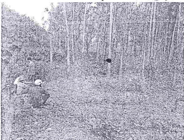
Hình 1: Hiện trạng điểm số 1 trước khi khai đào

Hiện trạng điểm số 1 và số 2 khu vực thi công số 5 ( phía Đông tiếp giáp với vườn cây bạch đàn, phía Tây là khu vực số 5, phía Bắc tiếp giáp với điểm số 2, phía Nam vườn cây bạch đàn): Tại điểm chôn lấp số 1 và số 2 còn nguyên trạng ban đầu khi kiểm tra phát hiện ngày 28/3/2014.