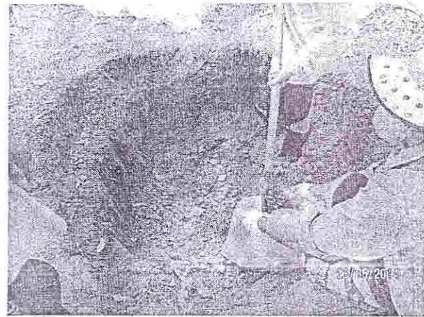
Hình 4: Điểm số 1 khai đào bốc xúc đóng gói chất thải, đất nhiễm