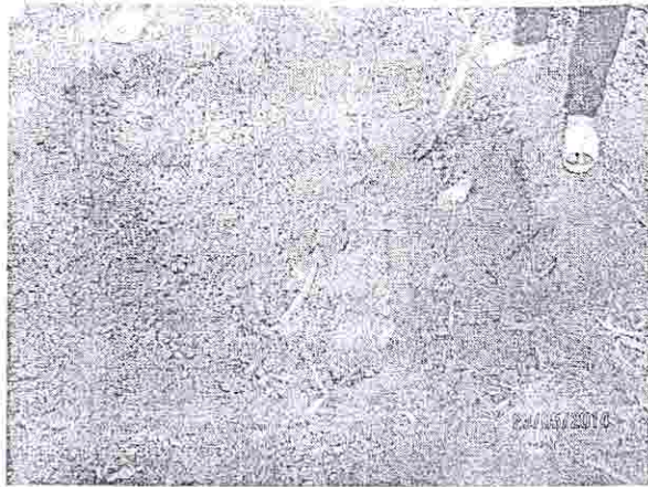
Hình 3: Điểm số 1 khai đào bốc xúc chất thải, đất nhiễm